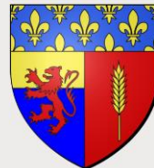
LA FORÊT-LE-ROI (91410)